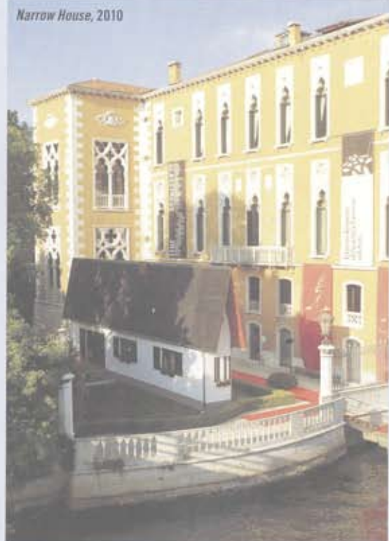
Narrow House, 2010