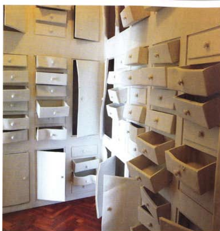
Le Cercle fermé, 2011